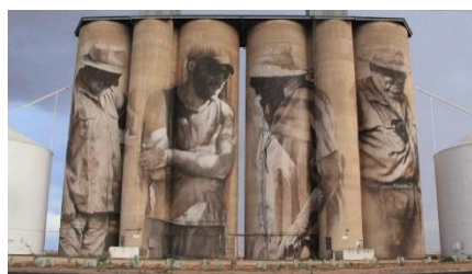
Bodega Solar de Samaniego

Située au pied du village médiéval de Laguardia, la Bodega Solar de Samaniego a su concilier, dès 1972, histoire et tradition au cœur de la Rioja Alavesa pour créer des vins de renommée internationale. L'occasion de découvrir l'intervention artistique monumentale de l'artiste autralien Guido van Helten qui a travaillé sur des réservoirs d'une capacité d'un demi-million de litres. Une œuvre absolument exceptionnelle ! La dégustation sera suivie d'un repas en commun.