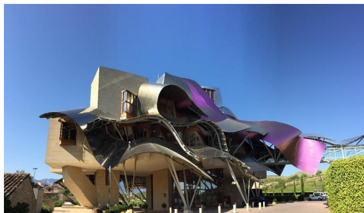
Hôtel Marques de Riscal dessiné par l'architecte Franck Gehry

Grâce à un microclimat privilégié pour la culture de la vigne, c'est dans cette région de la Rioja Alavesa que sont élaborés les fameux vins de la Rioja. L'empreinte humaine est remarquable dans cette région où les signatures de grands architectes comme Calatrava, Gehry ou Zaha Hadid s'affichent sur de nombreuses constructions et caves. Puis, nous découvrirons Laguardia, petite ville médiévale qui abrite un trésor : le portail gothique polychrome du 17 e siècle, de l'église Santa Maria de los Reyes.