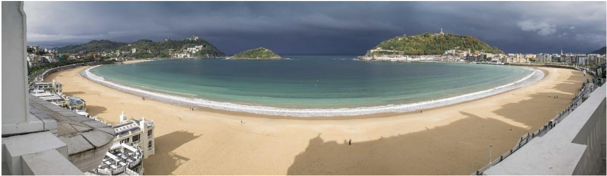
Baie de la Concha à Saint-Sébastien

La ville est située dans la province de Guipuzcoa. Quand une ville a la chance de se trouver en bord de mer, c'est un grand atout et si la mer et la terre se fondent en une composition géniale qui allie monts verdoyants et plages de sable fin, alors cette ville est digne de sa réputation. Elle a accueilli la Reine Maria-Cristina qui en 1845 en fit la station à la mode adoptée par l'aristocratie. Jorge Oteiza et Eduardo Chillida, deux sculpteurs l'ont parsemée de leurs œuvres. Lors d'une halte de dégustation, la Bodega Berroja vous fera découvrir un vin typique de la région le « Txakoli »