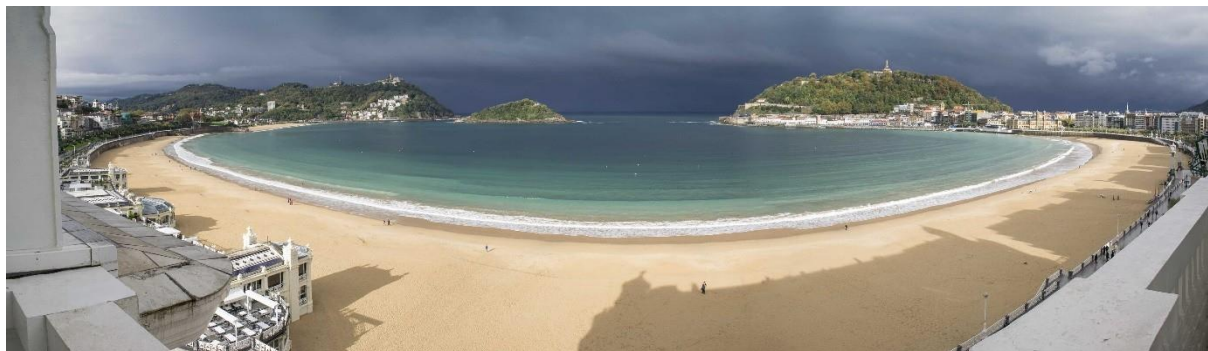
Baie de la Concha à Saint-Sébastien

La ville est située dans la province de Guipuzcoa. Quand une ville a la chance de se trouver en bord de mer, c'est un grand atout et si la mer et la terre se fondent en une composition géniale qui allie monts verdoyants et plages de sable fin, alors cette ville est digne de sa réputation. Elle a accueilli la Reine Maria-Cristina qui en 1845 en fit la station à la mode adoptée par l'aristocratie. Jorge Oteiza et Eduardo Chillida, deux sculpteurs l'ont parsemée de leurs œuvres. A Getaria, une visite guidée du Musée Cristobal Balenciaga nous présente les créations de ce grand couturier hors du commun.