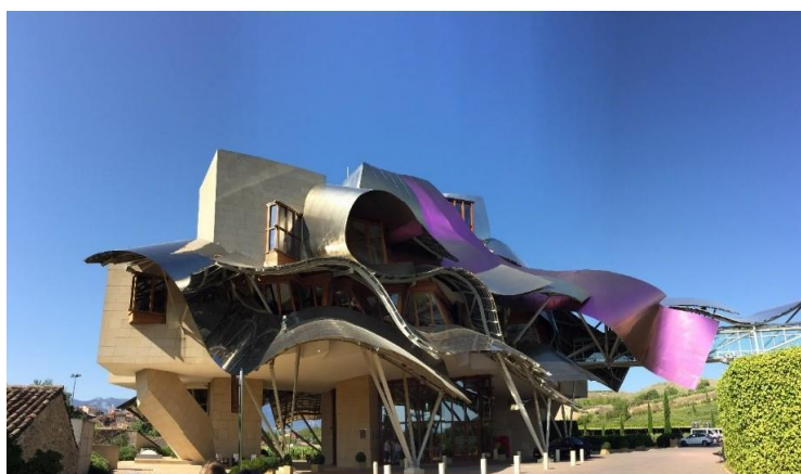
Hôtel Marques de Riscal dessiné par l'architecte Franck Gehry

Grâce à un microclimat privilégié pour la culture de la vigne, c'est dans cette région de la Rioja Alavesa que sont élaborés les fameux vins de la Rioja. L'empreinte humaine est remarquable dans cette région où les signatures de grands architectes comme Calatrava, Gehry ou Zaha Hadid s'affichent sur de nombreuses constructions et caves. Puis, nous découvrirons Laguardia, petite ville médiévale qui abrite un trésor : le portail gothique polychrome du 17 e siècle, de l'église Santa Maria de los Reyes.