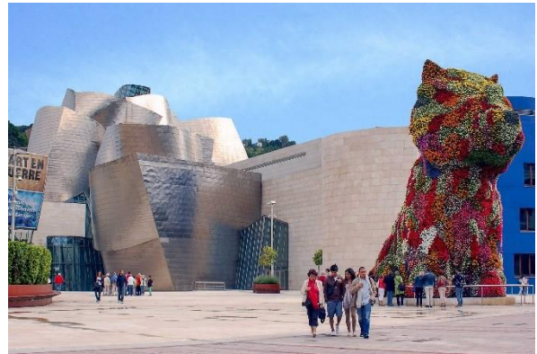
Guggenheim & Puppy de Jeff Koons